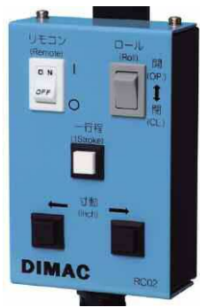
Commande à distance