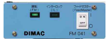
Unité de contrôle avancements longs