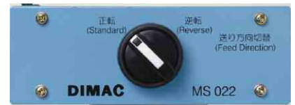
Unité inversion direction