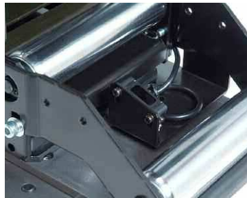
Capteur fin de bande